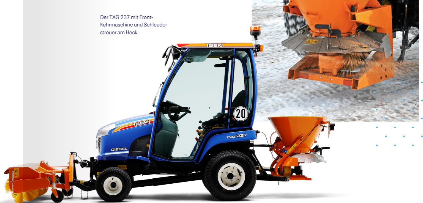
Der TXG 237 mit Frontkehrmaschine und Schleuderstreuer am Heck.