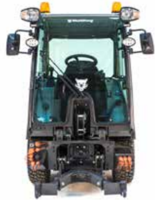
CX 55 SPEZIFIKATION