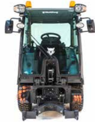
CX 55 L / CX 75 SPEZIFIKATION