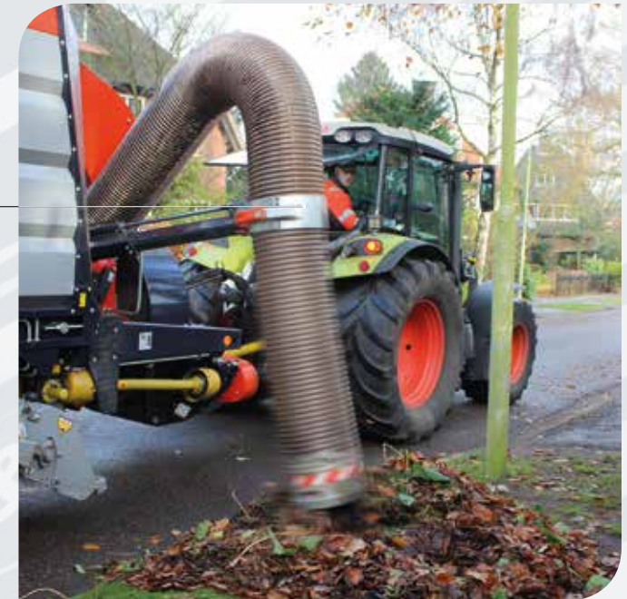
Bedienung des Saugschlauchs mit der Joysticksteuerung.