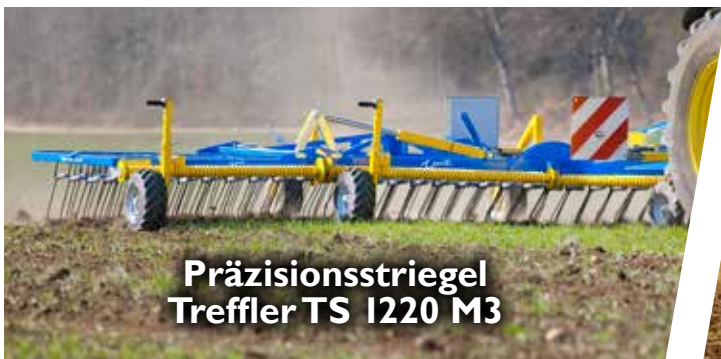
Präzisionsstriegel Treffler TS 1220 M3