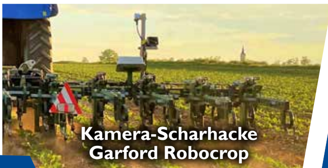
Kamera-Scharhacke Garford Robocrop