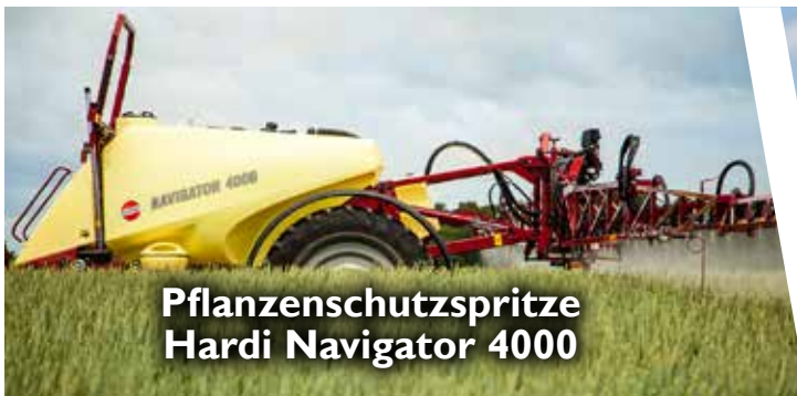
Pflanzenschutzspritze Hardi Navigator 4000