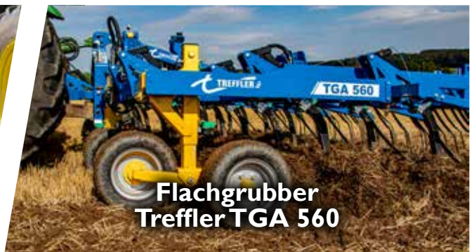
Flachgrubber Treffler TGA 560