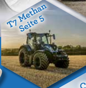
T7 Methan Seite 5