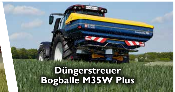
Düngerstreuer Bogballe M35W Plus