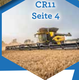
CR11 Seite 4