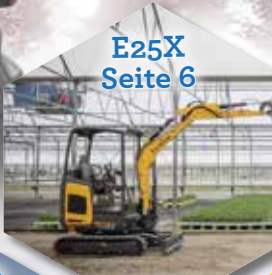
E25X Seite 6

Top Partner WINNING IN ALL FIELDS PREMIUM