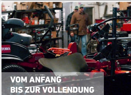
VOM ANFANG BIS ZUR VOLLENDUNG

Von baulichen Maßnahmen über Landschaftspflege bis hin zum Mähen, Toro® bietet optimale Lösungen, die perfekt auf ihre Arbeitsaufgaben zugeschnitten sind.