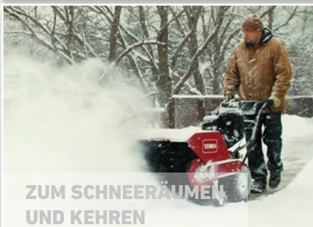
ZUM SCHNEERÄUMEN UND KEHREN