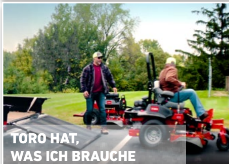
TORO HAT, WAS ICH BRAUCHE